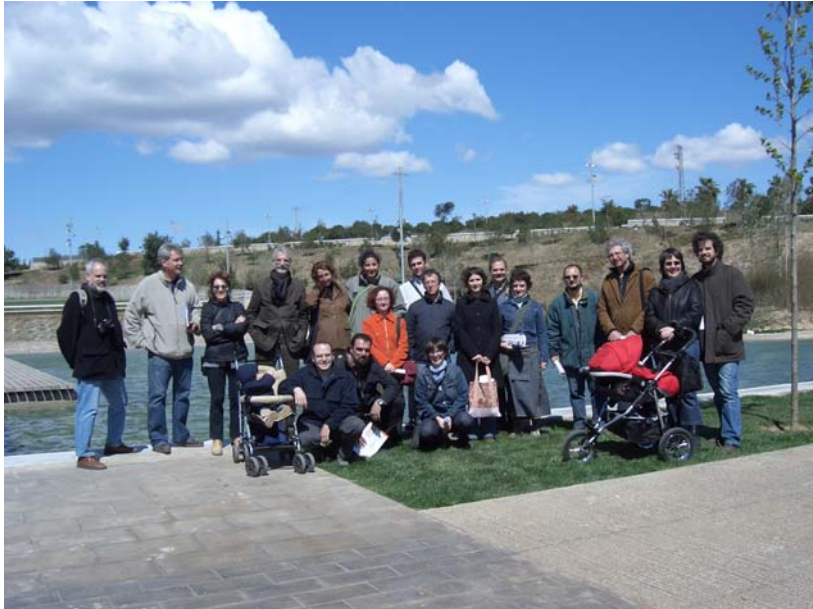
Foto de grup durant la visita al Parc de la Muntanyeta (St. Boi de Llobregat)