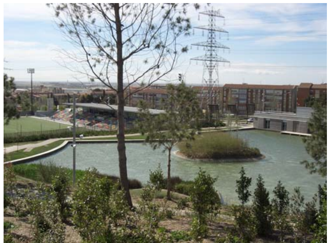
Parc de la Muntanyeta (St. Boi de Llobregat)

La intervenció d'en Roger Junqueras, assistent a la visita i tècnic responsable del manteniment d'aquest parc per part de CESPÀ, va ser molt interessant ja que també es va poder conèixer l'opinió de l'empresa que viu des de "l'altre banda" aquest tipus de control de qualitat.