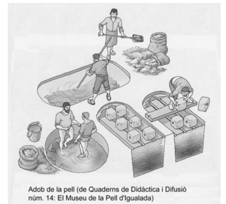
Adob de la pell (de Quaderns de Didàctica i Difusió núm. 14: El Museu de la Pell d'Igualada)

Restava per a una altra ocasió explicar l'origen de la paraula adob i la relació entre les dues accepcions més freqüents, l'esmentada en aquest escrit relativa a la indústria de la pell i la de fertilitzant en agricultura i jardineria.