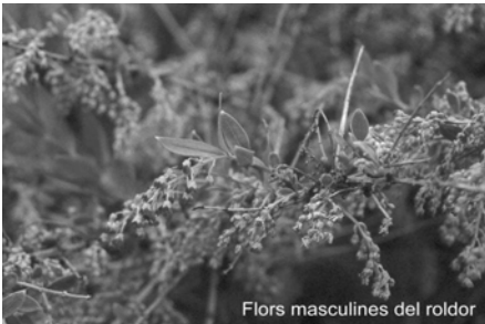
Flors masculines del roldor

també que de les fulles endurides, pròpies de moltes plantes mediterrànies, se'n diu que són coriàcies .